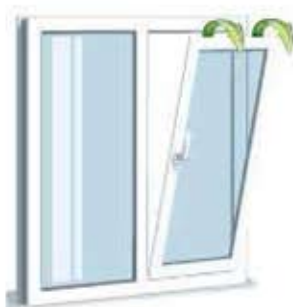
Ventilatia de vara

sau pozitia basculata pentru schimbul de aer permanent, cu diferente mici intre aerul interior si cel exterior